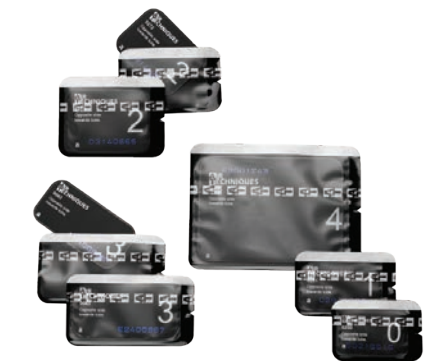
Size 4 (57×76mm)

製造販売元: 朝日レントゲン工業株式会社 製造元: デュールデンタル社(ドイツ)