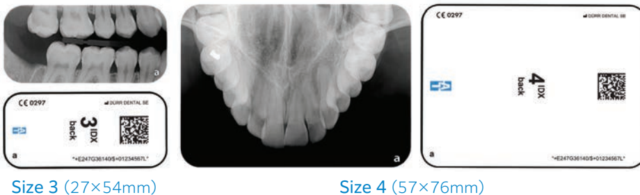
Size 3 (27×54mm)