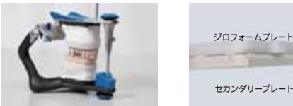
セカンダリープレートは、マグネット式で同じ位置に必ず戻る様に設計されているため、何度も着脱を行うことが可能です。