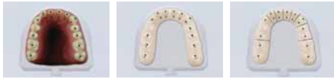
口腔内の様子。黒い点は比較のための定点。 ジロフォームによって製作された作業模型(カット前)。定点より誤差が生じていることが分かる。 カット後のジロフォーム模型。カットすることにより、膨張分が補正され、正確な位置関係の作業模型が製作できていることがわかる。

ジロフォームとジロフォームプレートを使用する事により、歯の位置、歯列弓はあらかじめ正確に決定されています。ただし、石膏模型は硬化膨張しているため、そのままでは適合しません。その為、石膏模型をカットすることにより、膨張分が補正されることとなります。