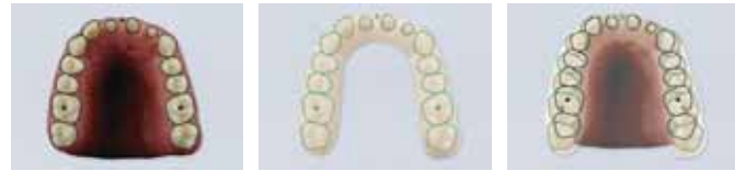
口腔内の様子。 製作された作業模型。 口腔内の位置と作業模型の位置の重ね合わせ。位置や大きさなど誤差が生じていることが確認できる。

通常の石膏による作業模型では、一次石膏や二次石膏において硬化膨張や吸水膨張による誤差(大きさ/位置など)が生じることとなり、模型の精度に重要な影響を及ぼします。