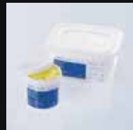
ジロフォームバテ(1kg) ジロフォームバテ(5kg)