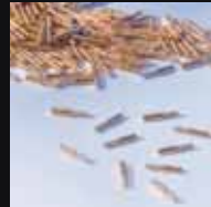
ジロフォームピン