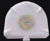
ジロフォーム プレミアムプレート