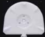
ジロフォーム クラシックプレート