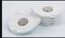
ジロフォーム セカンダリープレート